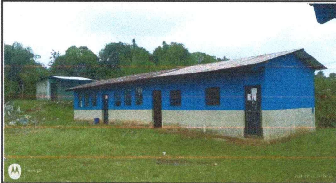
Foto 1: Sustitucion de laminas y costaneras de aulas en mal estado